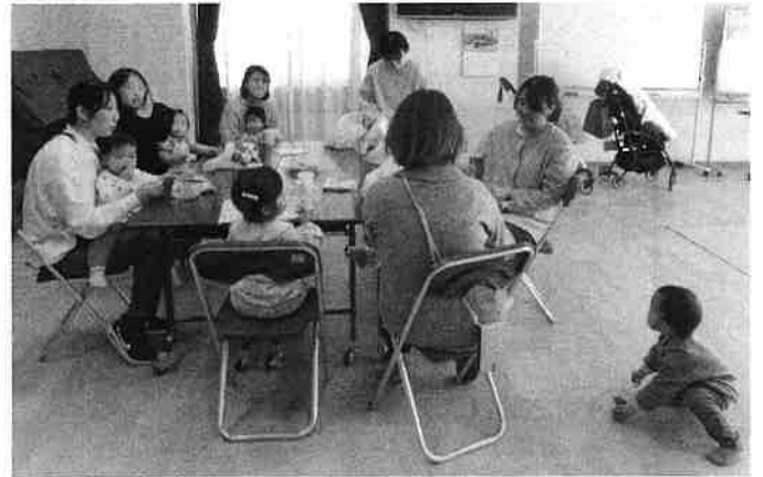
★ 色々な情報を交換しています ★

キキララは、お母さんたちの集いの場所です。この日初めて参加された方も楽しそうにお喋りをしていました。子どもたちもスタッフとおもちゃで遊んだり、お母さんの所に行ったり自由に過しました。