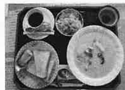
メニュー ホワイトシチュー・野菜サラダ、 食パン、バナナ、淹たてコーヒー