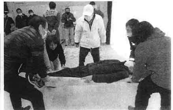
★ 応急担架作成・搬送訓練 ★