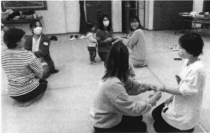
★ お母さんたちのリラックスタイム ★