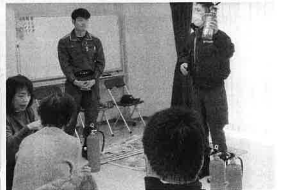
★ 消火器の取扱訓練 ★