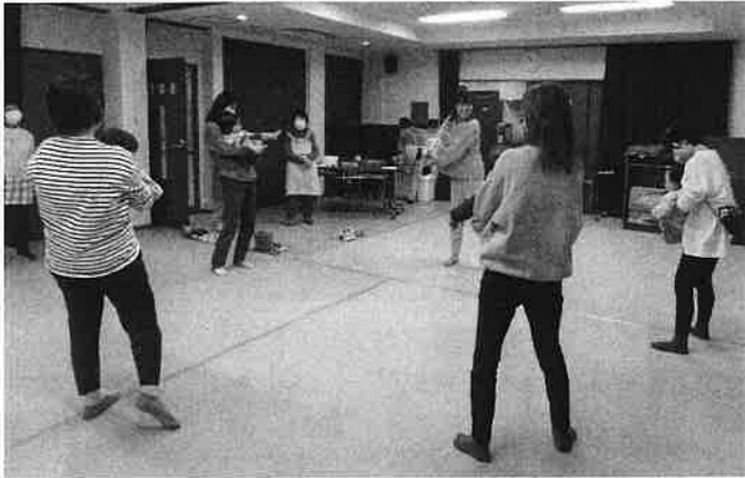
★ 親子で触れ合いながら、ヨガを楽しみました ★