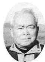
星陵台ふれあいのまちづくり協議会