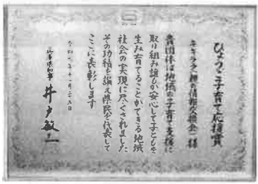
「令和元年ひょうご子育て応援賞」を受賞しました。