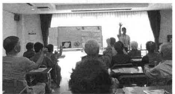
垂水あたまいきいき体操