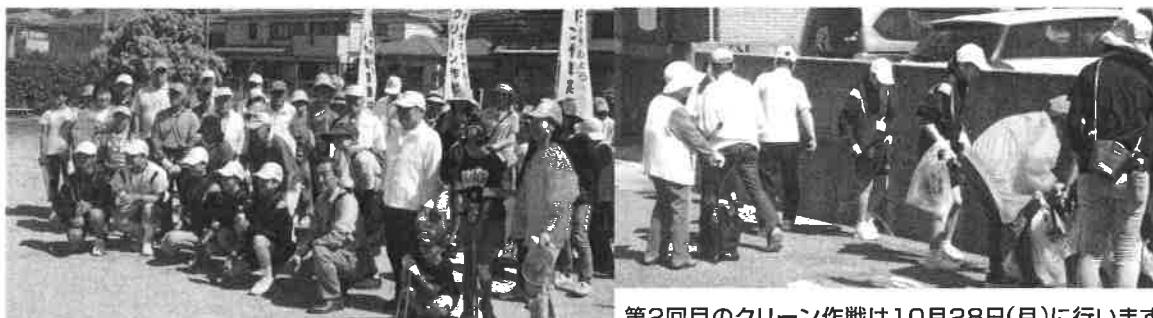
第2回目のクリーン作戦は10月28日(月)に行います。

タバコの吸殻、ジュース類のペットボトル・缶のゴミ捨て状態は残念ながら解決されておりません。皆さん、マナーを守って美しい街にしましょう!!