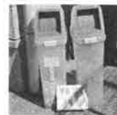
毎月 第1月曜日に 回収しました