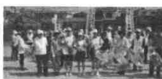
・6月 4日(参加者53人) ・10月22日(参加者39人) 星陵台中学校生徒も参加しました