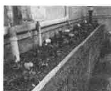
シクラメン、葉牡丹 を植えました