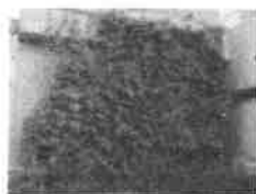
ゴーヤで緑のカーテン をつくりました