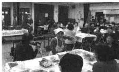
試食後の感想は、良い体験をしたとの意見が多くありました