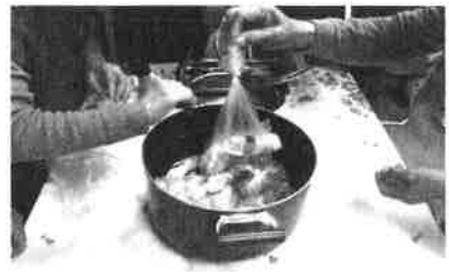
沸騰したお湯で約20分間煮ました (メニュー3種類同時に入れました)