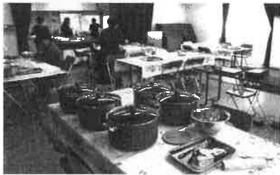
道具一式(鍋、ポリ袋等)