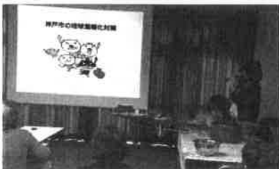
環境学習もしました