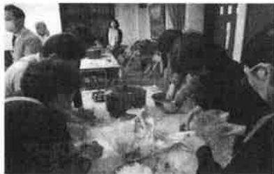
ポリ袋に材料・調味料を入れ、 空気を抜きました